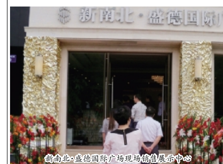
新南北·盛德国际广场现场销售展示中心

【编者按】当“金九银十”的传统旺季遇上“解限”政策落地,集团公司旗下蓄势待发的各楼盘选择于近期先后亮相公众,“开盘潮”华丽来袭。无论是首开项目还是续开房源,均获得了购房者的一致认可和市场的极高关注度。本报将从不同角度向读者们介绍近期集团旗下开盘的各大楼盘近况,希望随着市场的不断升温,各楼盘在年末都能上交一份令人满意的答卷!