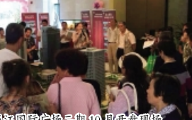
欣北·钱江国际广场二期 10 月开盘现场

【编者按】近年来,集团公司的员工培训机制不断丰富与完善,并逐渐建立起了一套和公司人才选拔相结合的培训体系。全体员工对于这种提升自我、双向沟通的方式均表现出浓厚兴趣和极大肯定,企业的凝聚力和竞争力也得到了增强。近期,集团公司通过组织企业内训、参加外部专题培训等方式先后开展了两次培训,以期将公司的培训体系贯彻执行到位,不断提升员工的专业水平和职业素养。