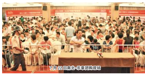
7月22日南北·乐章团购现场

本报讯 继6月火爆的开盘行情之后,7月以来集团公司的各个楼盘丝毫没有降温的迹象,反而愈加炙手可热。由杭州青枫房地产开发有限公司开发的青枫墅园语山组团和由杭州新南北房地产开发有限公司开发的南北·乐章项目,在这一个月中“遭遇”了客户漏液排队、开盘一小时内售罄、百余套房源千人摇号、紧急加推……虽然这两个项目地段不同,但同样有口皆碑的品牌、经济实惠的价格、舒适宜居的空间、厚积薄发的升值潜力,引发了一波又一波的抢购高潮。