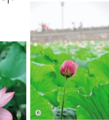
⑥⑦⑧(作者:青枫公司 叶其森)