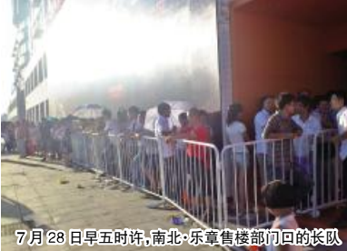
7月28日早五时许,南北·乐章售楼部门口的长队

此次南北·乐章加推14号楼共68套房源,采用先到先得的选房方式。其中,70多方的小户型仍然为主打户型,且房源数量不多,许多志在必得的意向客户于7月27日深夜就赶到现场售楼部。凌晨12点左右,售楼部门口就已经聚集有十几组客户。