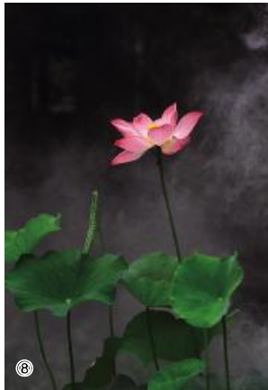
⑧⑨⑩(作者:招标采购部 李桂荣)