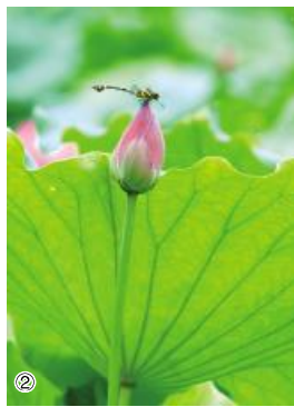
①②(作者:规划发展部 黄昌柯)