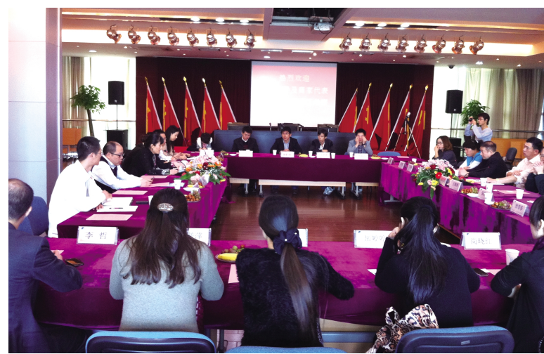
钱江国际广场商家恳谈会现场

此次活动由浙江新宸宜投资有限公司和钱江经济开发区管委会商务局联合组织,并由杭州市贸易局协助邀请了杭州市餐饮协会、杭州市酒吧行业协会、杭州市咖啡西餐协会等行业协会的会长及世纪联华、乐购、粗菜馆等众多商家代表共同参与。