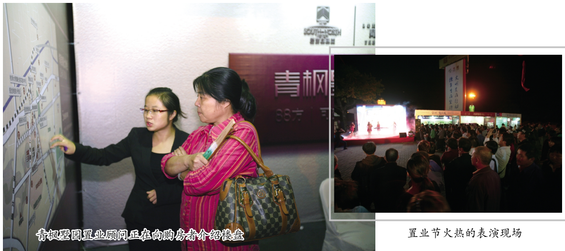
青枫墅园置业顾问正在向购房者介绍楼盘