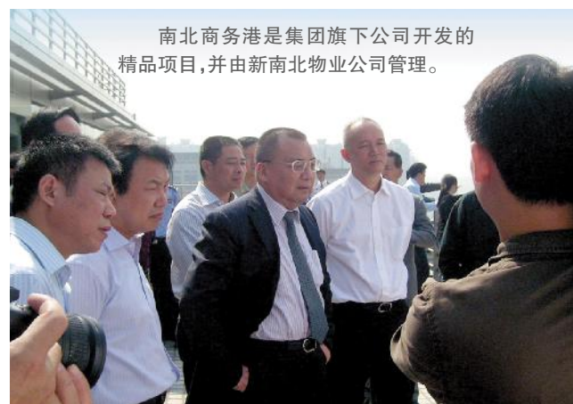
南北商务港是集团旗下公司开发的精品项目,并由新南北物业公司管理。

商务港服务中心的全体员工积极为本次大会和浙江电视台、杭州电视台,107城市之声电台做好前期准备工作和大会当晚的各项工作。